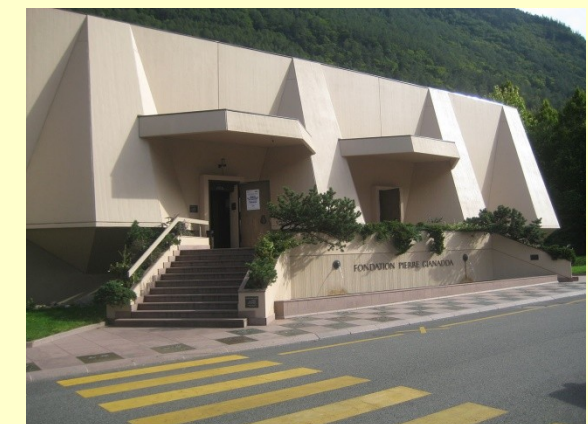
Culture et gastronomie locale